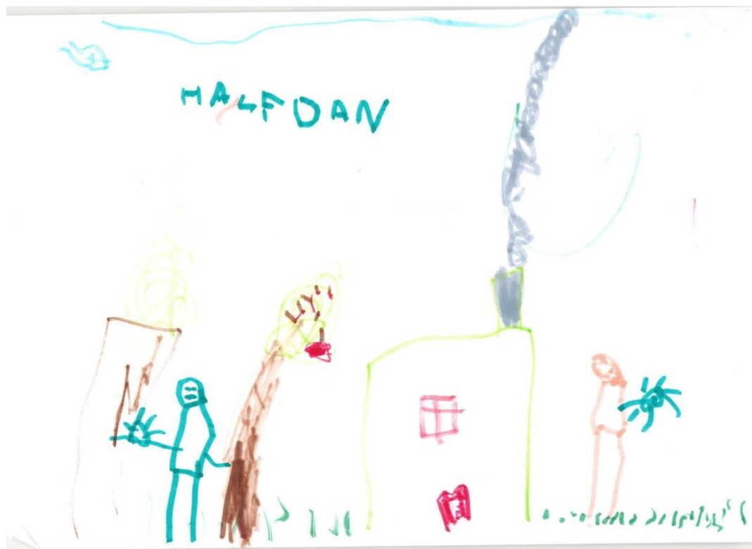
Halfdan 5 år