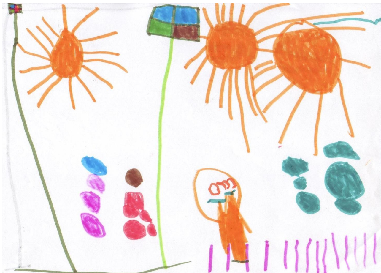
Thomas 5 år

Vi er meget meget glade!! Det var SÅ hyggeligt at se!