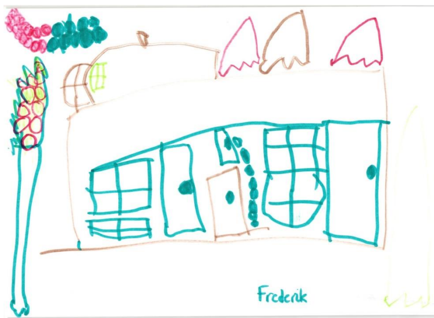
Frederik 4 år