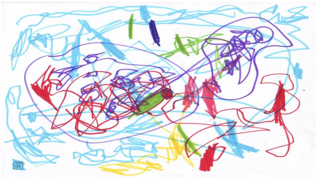
Thomas 4 år