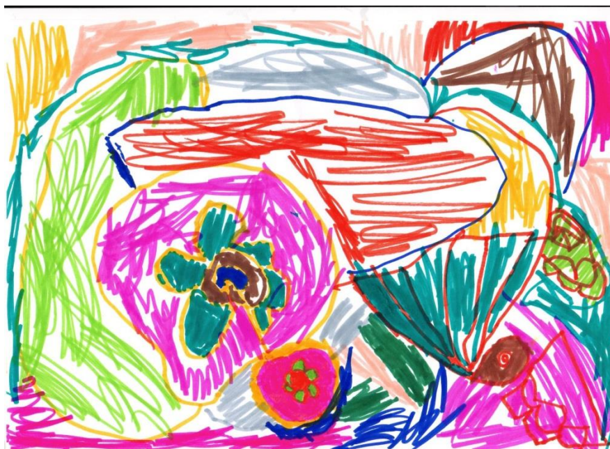
Ella 5 år