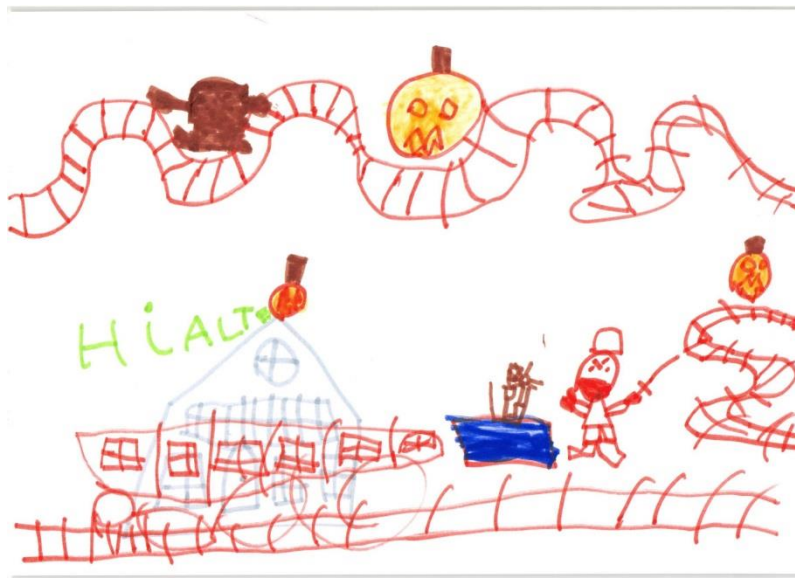
Hjalte 4 år