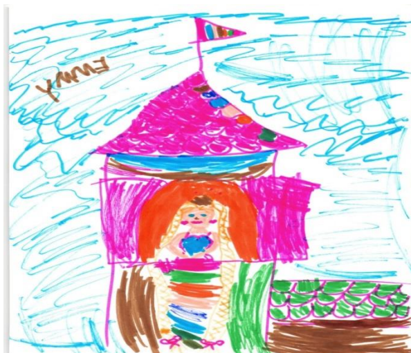
Emmy 5 år