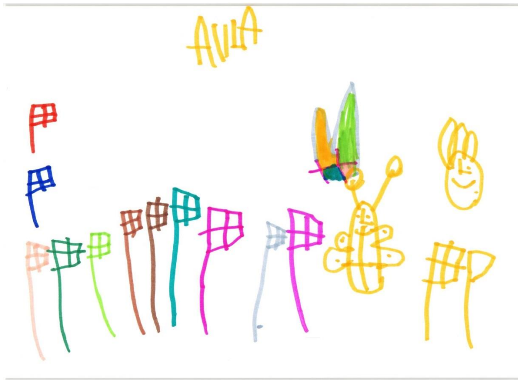
Alva 4 år