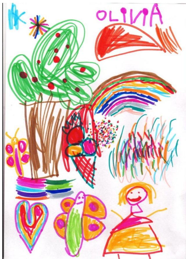
Olivia 5 år