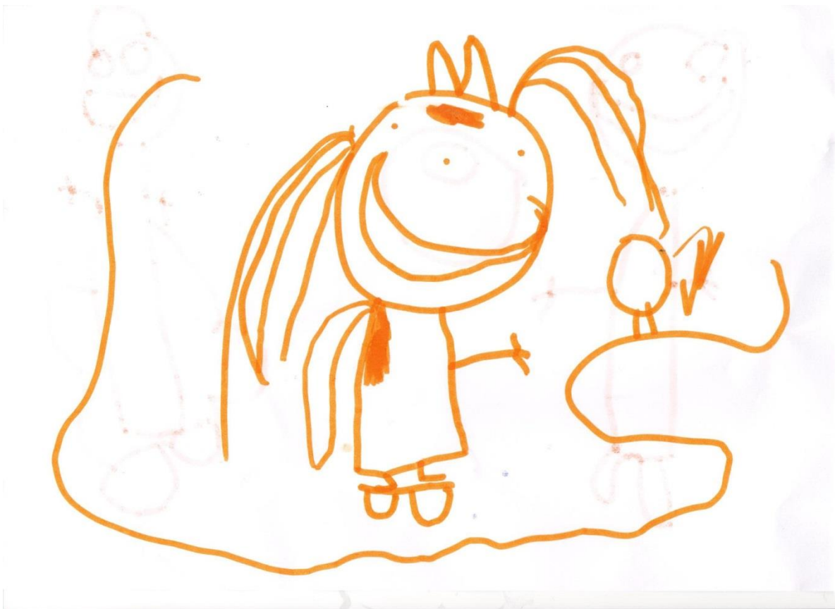
Addis 4 år