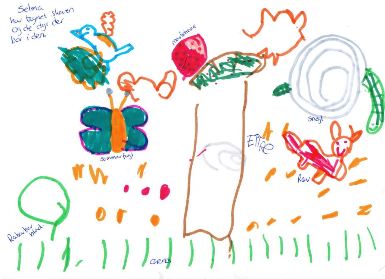
Selma 5 år