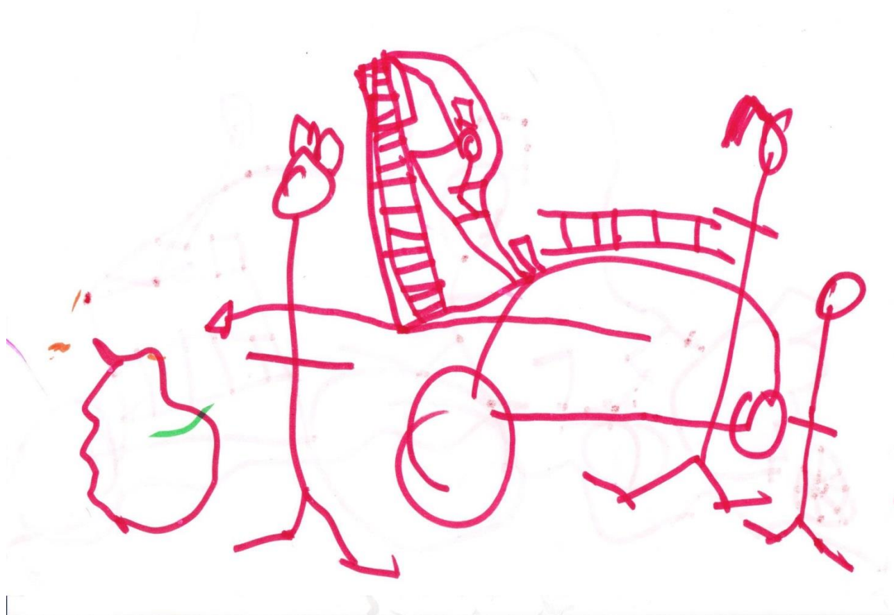
Hjalte 3 år.